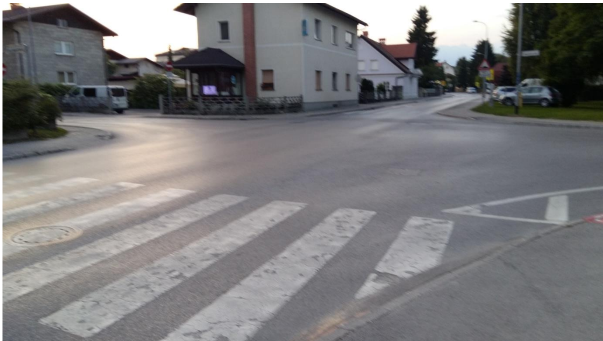
Slika 7: Križišče z Ulico Matije Tomca, Slamnikarsko cesto in Miklošičevo cesto Prečkanje križišča je pregledno. Šolarji morajo pri prečkanju upoštevati pravila prečkanja cestišča in navodil šolar – pešec (6.1) ter šolar – kolesar (6.2).