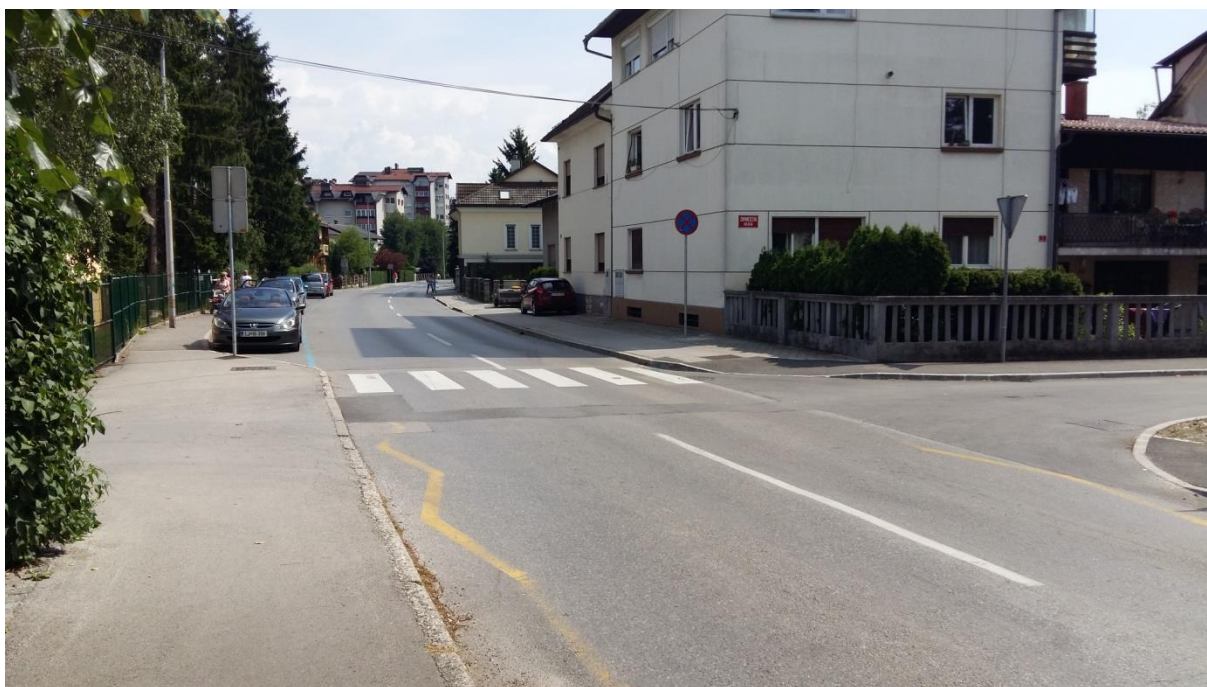
Slika 6: Prehod za pešce pri vrtcu Urša Na poti v šolo morajo biti šolarji pri prečkanju cestišča pozorni, saj se šolarji iz Župančičeve ulice priključijo na Slamnikarsko cesto, ki je v zgodnjih jutranjih urah in v popoldanskem času zelo prometna. Preden prečkajo cestišče, naj upoštevajo pravila prečkanja in navodila šolar – pešec (6.1) ter šolar – kolesar (6.2).