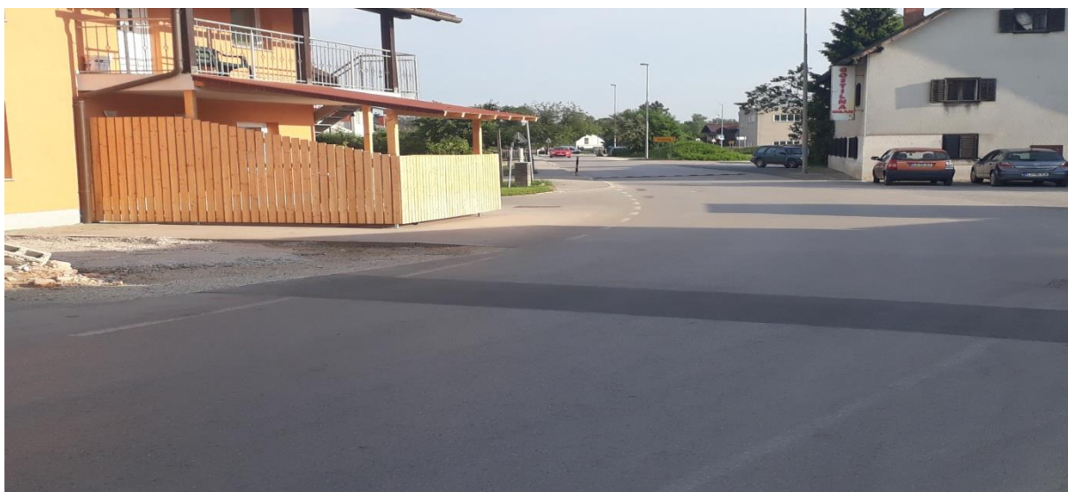
Slika 8: Parkirišče Mngan Parkirišče pri gostilni Mngan je večinoma zasedeno. Naprej sledi nepregleden ovinek. Cesta je v tem delu brez pločnika, zato je šolar v nevarnosti. Zaradi ovinka je cesta iz smeri Preloga v tem delu nepregledna. Potrebna je velika previdnost in upoštevati je treba navodila šolar – pešec (6.1).