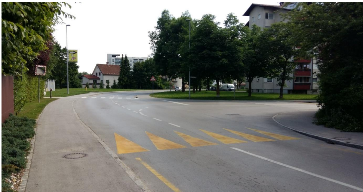
Slika 5: Križišče z Miklošičevo ulico, Cesto talcev in Rojsko cesto Križišče je pregledno, vendar mora biti šolar pri prečkanju previden. Preden stopi na vozišče, naj preveri, ali se je vozilo ustavilo, in šele nato prečka cestišče, ob tem pa upošteva navodila šolar – pešec (6.1).