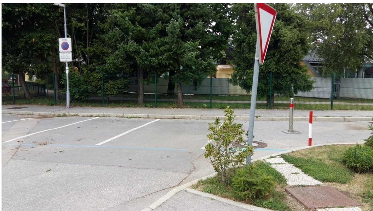
Slika 4: Bistriška cesta

Cesta je urejena s pločnikom in je varna. Nevarnost se pojavi, ko starši šolarje v jutranjih urah pripeljejo z avtomobilom v šolo in se ustavijo na Bistriški cesti, kjer ni predvideno parkirišče. Staršem, ki pripeljejo šolarja z avtomobilom, svetujemo, da to storite na določenem mestu, šolskem parkirišču.