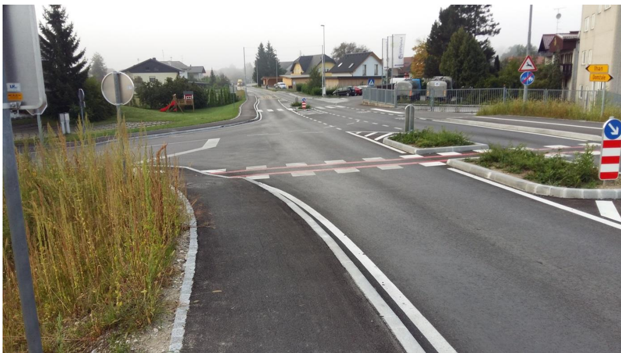
Slika 10: Križišče v Prelogu z Ihansko cesto Šolarji morajo biti pri prečkanju tega cestišča previdni, saj vozniki v tem delu večkrat ne upoštevajo in kršijo omejitve hitrosti. Šolar naj upošteva navodila šolar pešec (6.1.).