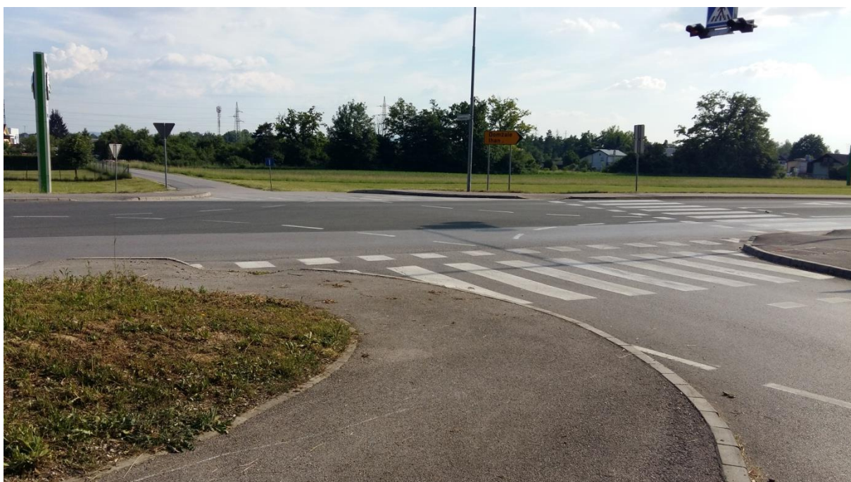
Slika 2: Krumperška ulica

Kljub zeleni luči za pešce, naj se šolar prepriča, če so se vozila na obeh straneh ustavila in varno prečka cestišče. Glej, navodila šolar-pešec (6.1.) ter šolar-kolesar (6.2.).