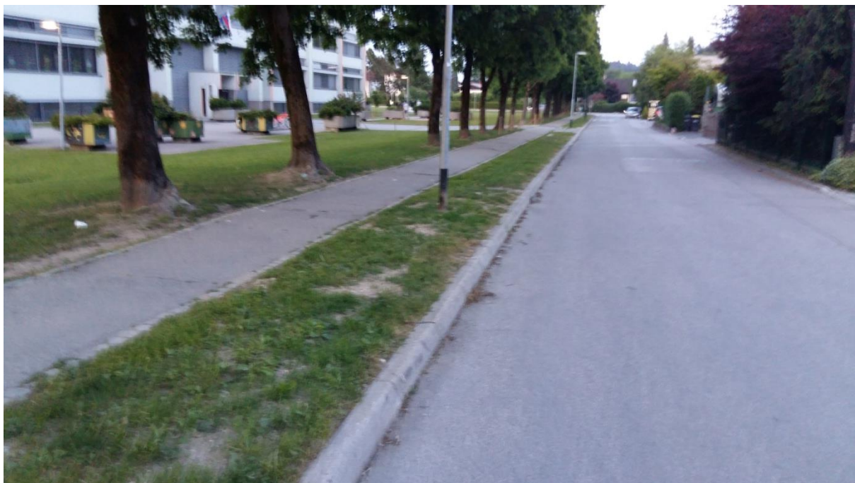
Slika 3: Bistriška cesta

Cesta je urejena s pločnikom in je varna. Nevarnost se pojavi, ko starši šolarje v jutranjih urah pripeljejo z avtomobilom v šolo in se ustavijo na Bistriški cesti, kjer ni predvideno parkirišče. Staršem, ki pripeljejo šolarja z avtomobilom, svetujemo, da to storite na določenem mestu, šolskem parkirišču.