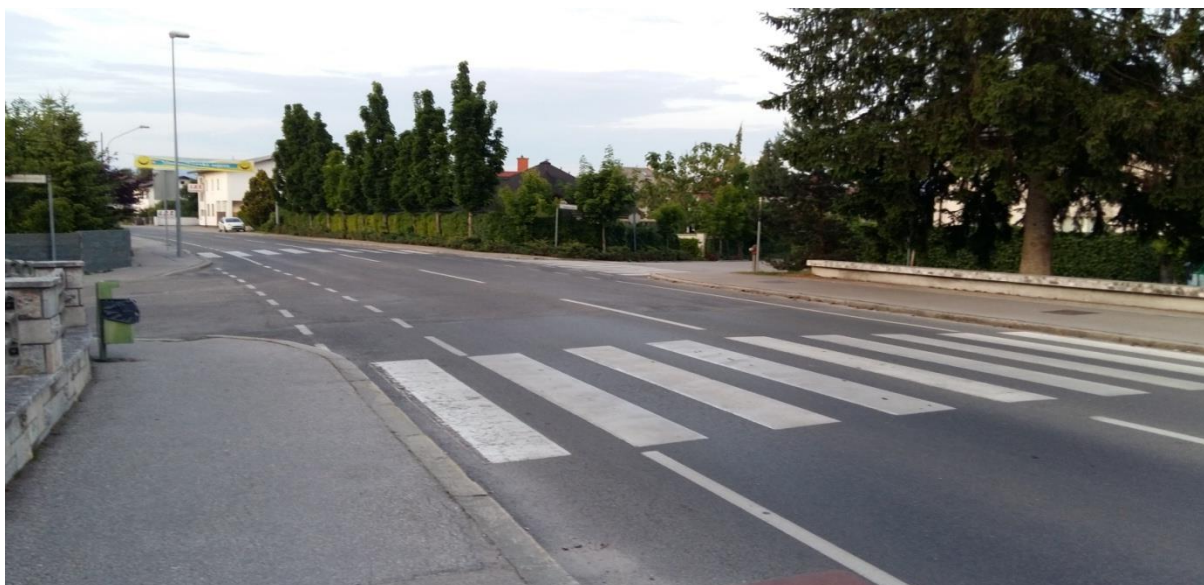
Slika 12: Prečkanje Ljubljanske ceste na križišču z Vegovo ulico in Levstikovo cesto

Križišče je pregledno, vendar je šolar v nevarnosti zaradi kršitve omejitve hitrosti, saj je cesta glavna pot do avtoceste proti Ljubljani. Potrebna je velika pazljivost pri prečkanju cestišča! Šolar naj upošteva navodila šolar-pešec(6.1.).