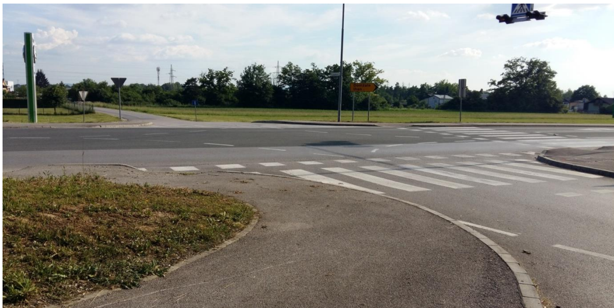
Slika 11: Križišče

Križišče je pregledno, vendar je šolar v nevarnosti zaradi kršitve omejitve hitrosti, saj je cesta glavna pot do avtoceste proti Ljubljani. Potrebna je velika pazljivost pri prečkanju cestišča! Šolar naj upošteva navodila šolar-pešec(6.1.).