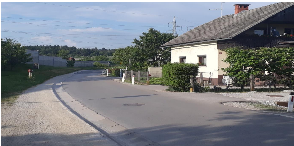
Slika 9: Nepregledni ovinek na Ihanski cesti. Cesta je v tem delu brez pločnika. Šolar mora hoditi ob levem robu cestišča in biti zelo previden in vidno oblečen.