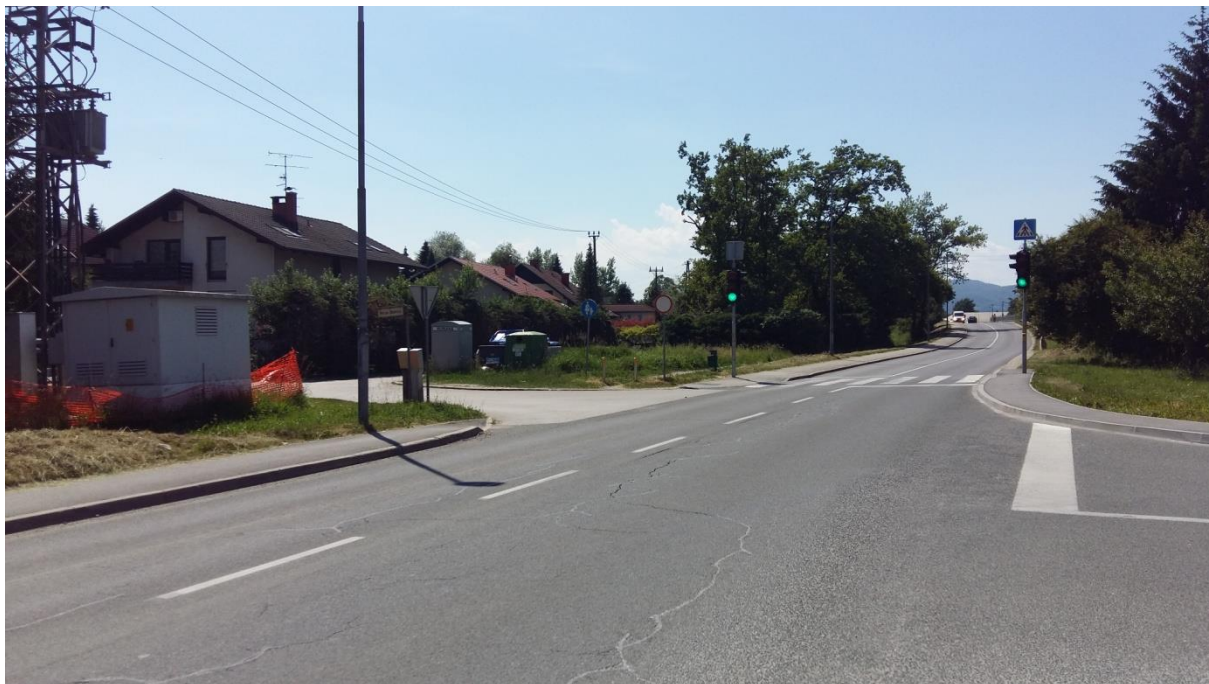
Slika 1: Pot za Bistrico

Kljub zeleni luči za pešce, naj se šolar prepriča, če so se vozila na obeh straneh ustavila in varno prečka cestišče. Glej, navodila šolar-pešec (6.1.) ter šolar-kolesar (6.2.).