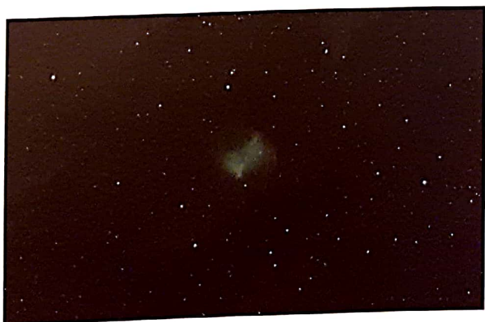
Planetarna meglica Ročka (M 27) v ozvezdju Lisička je eden lepših poletnih objektov.