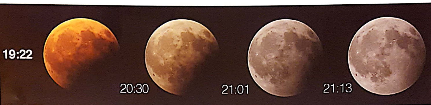
Posamezne faze delnega Luninega mrka, ki smo jih posneli prvi dan tabora.

Po 15 letih organiziranja astronomskih taborov si pač narediš malo inventuro (beri: generalko motorja) in si moraš odgovoriti na nekaj vprašanj, a ključno je tole: naj nadaljujem ali ne?