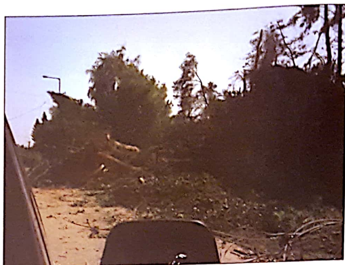
Posledice strašnega neurja s točo, ki je naredilo nekaj škode tudi v našem taboru.

Drugi dan smo se posvetili osnovam nastavljanja montaže teleskopa ter snemanju Sonca in Lune, žal pa je naš načrt – narediti podrobno karto Lune – padel v vodo, ker nismo zajeli vseh koščkov Lune. Uspehi pa smo narediti nekaj dobrih posnetkov Saturna in objektov iz globokega vesolja.