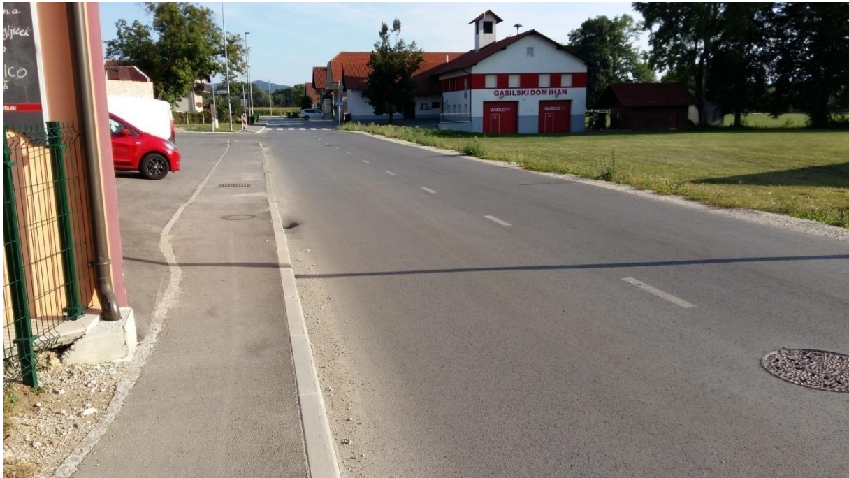
Slika 3: Pločnik pri Piceriji Dante Šolar naj bo pozoren na avtomobile, ki so parkirani pred picerijo. V tem delu odsvetujemo pot v šolo.