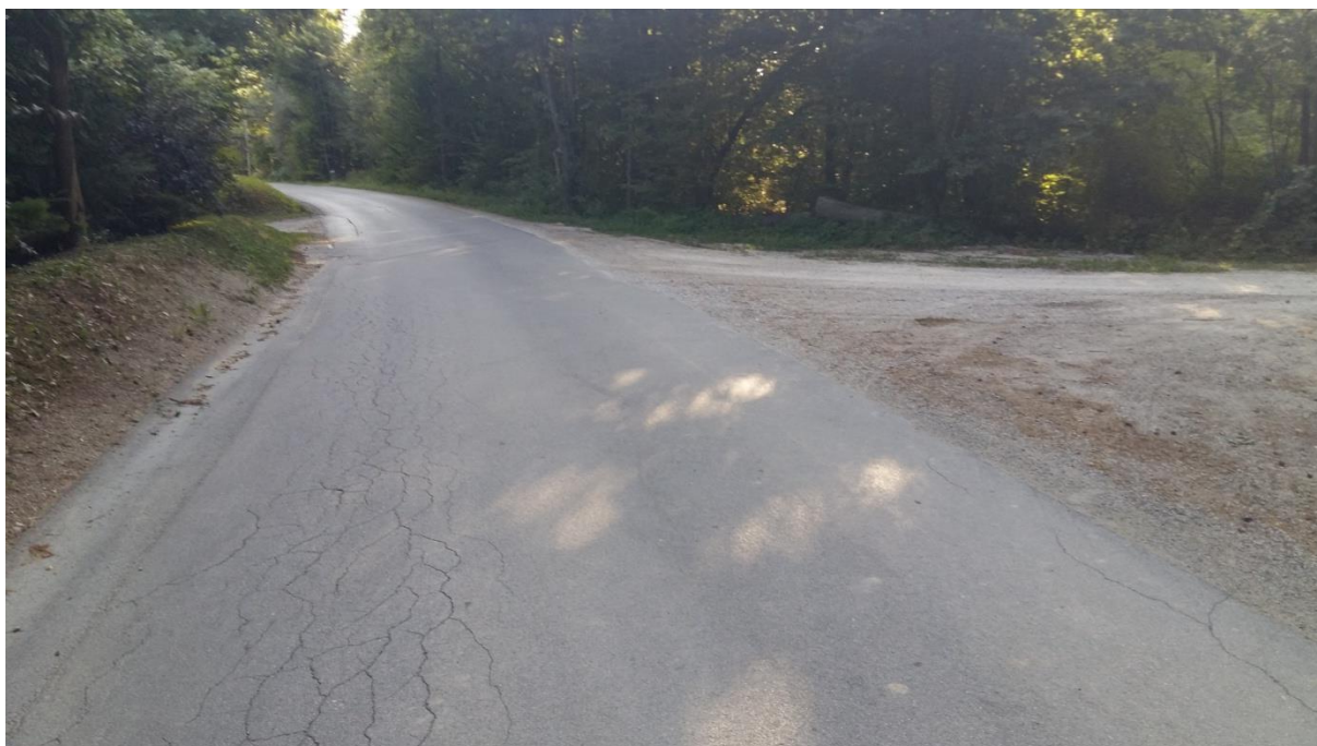
Slika 7: Postajališče je pregledno, cesta je brez pločnika. Šolar mora hoditi po levi strani ob robu cestišča. Cestišče lahko prečka šele takrat, ko je kombi že odpeljal. Preden prečka cestišče, naj upošteva pravila prečkanja in navodila šolar – pešec (6.1).