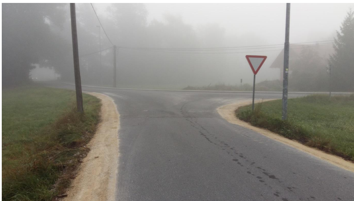
Slika 6: Križišče iz Bišč v Selu pri Ihanu Križišče je nepregledno, šolar pa je v nevarnosti tudi zaradi kršitve omejitve hitrosti. Cesta iz smeri Bišč je brez pločnika, zato naj šolar hodi ob levem robu cestišča. Pozoren naj bo pri prečkanju ceste. Preden prečka cestišče, naj upošteva pravila prečkanja in navodila šolar – pešec (6.1) ter šolar – kolesar (6.2).