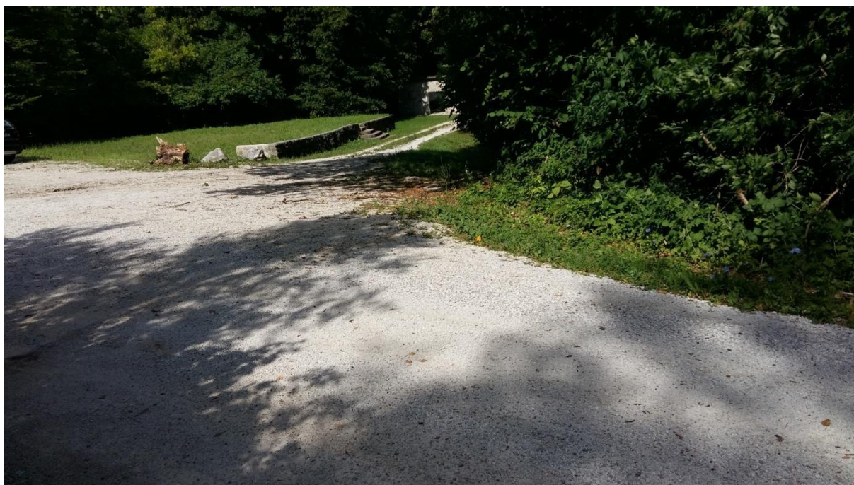
Slika 9: Postajališče na Oklu Postajališče je pregledno. Cesta je brez pločnika. Šolar mora hoditi po levi strani ob robu cestišča. Ko izstopa iz kombija, mora šolar počakati, da kombi odpelje, in šele nato prične z varno hojo ali prečkanjem cestišča.