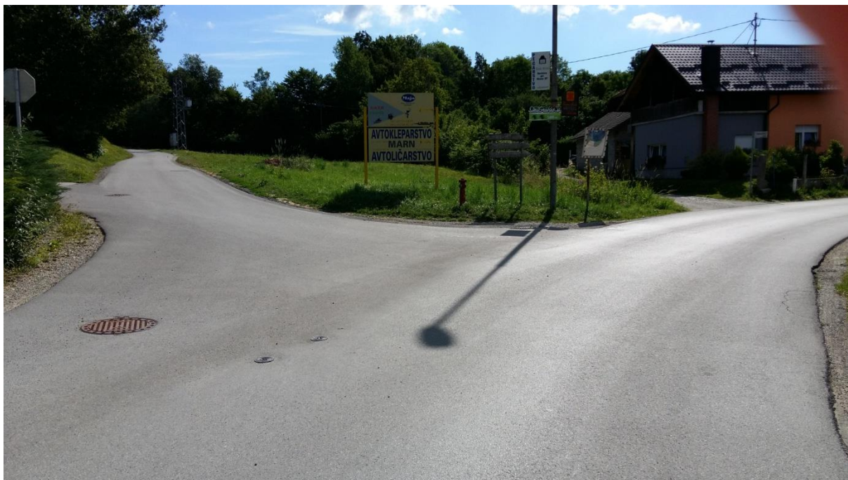
Slika 6: Postajališče Goričica pri Ihanu Postajališče je pregledno, cesta pa je brez pločnika. Šolar mora hoditi po levi strani ob robu cestišča. Cestišče lahko prečka šele takrat, ko je kombi že odpeljal. Preden prečka cestišče, naj upošteva pravila prečkanja in navodila šolar – pešec (6.1).