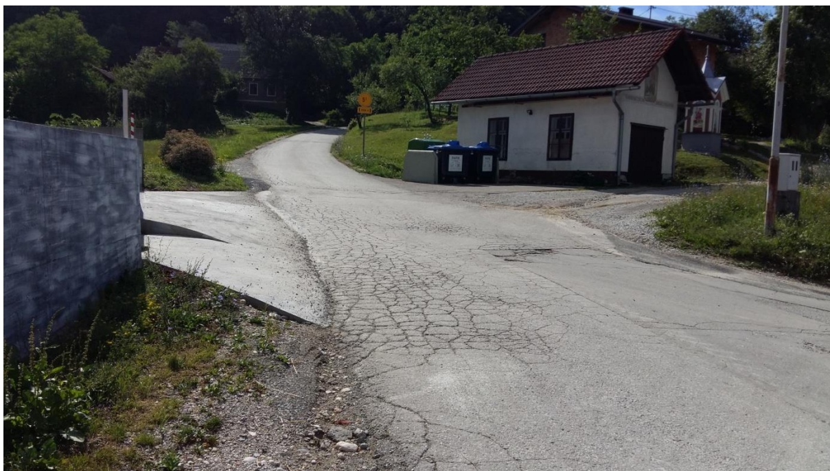
Slika 7: Postajališče na Brdu pri Gasilskem domu je pregledno. Cesta je brez pločnika. Šolar mora hoditi po levi strani cestišča. Ko izstopa iz kombija, mora šolar počakati, da kombi odpelje, in šele nato prične z varno hojo ali prečkanjem cestišča. Pri prečkanju upošteva pravila prečkanja in navodila šolar – pešec (6.1).