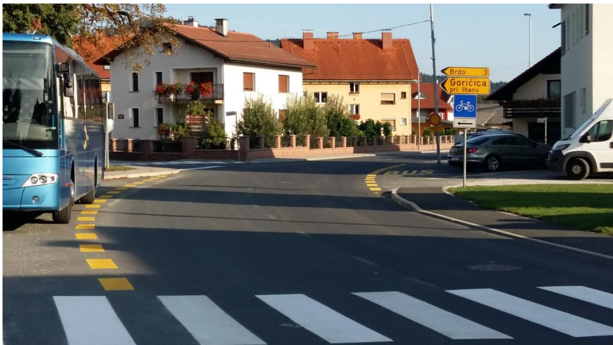
Slika 4: Križišče s Taborsko cesto in Breznikovo cesto Križišče je nepregledno, vendar je šolar v nevarnosti zaradi kršitve omejitve hitrosti. Pri prečkanju mora biti previden. Preden stopi na vozišče, naj preveri, da se je vozilo ustavilo, in šele nato prečka cestišče.