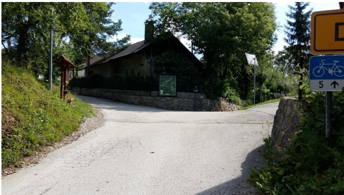
Slika 8: Postajališče v Dobovljah ni pregledno, cesta je brez pločnika. Šolar mora hoditi po levi strani ob robu cestišča. Ko izstopa iz kombija, mora šolar počakati, da kombi odpelje, in šele nato prične z varno hojo ali prečkanjem cestišča. Pri prečkanju upošteva pravila prečkanja in navodila šolar – pešec (6.1).