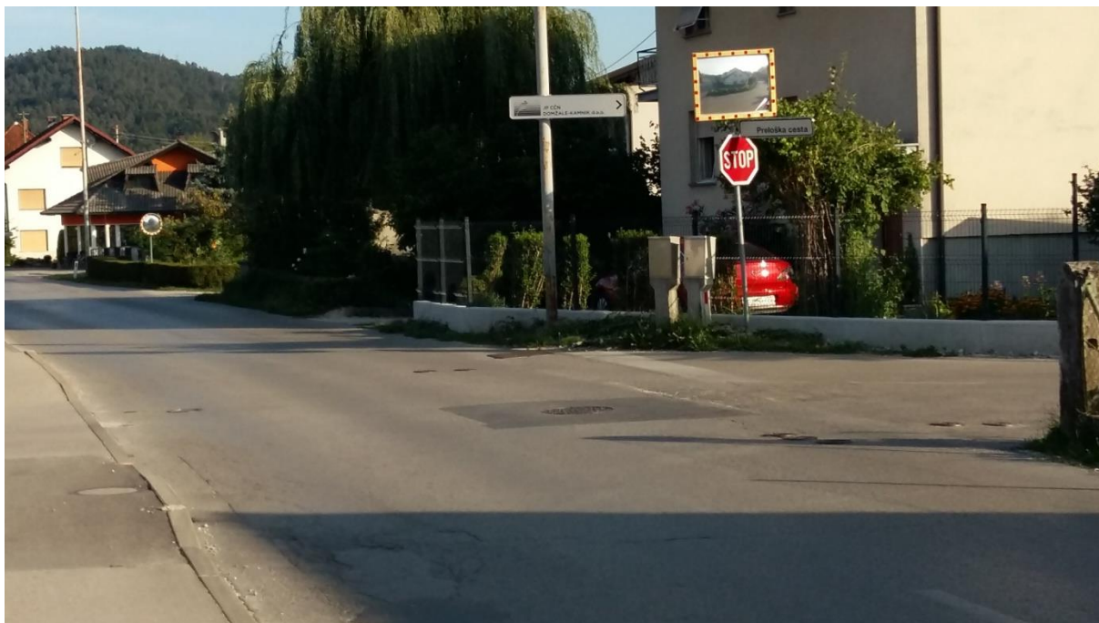
Slika5: Križišče z Breznikovo in Preloško cesto Po Preloški cesti se je v zadnjem času zgostil promet. Šolar naj hodi ob levem robu cestišča in naj bo pozoren pri prečkanju ceste, saj se s Preloške ceste priključi na Breznikovo cesto. Preden prečka cestišče, naj upošteva pravila prečkanja in navodila šolar – pešec (6.1) ter šolar – kolesar (6.2).